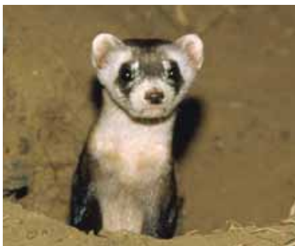
OBĚŤ MORU: Ohrožený tchoř černonohý se nakazil od psounů préríjních.