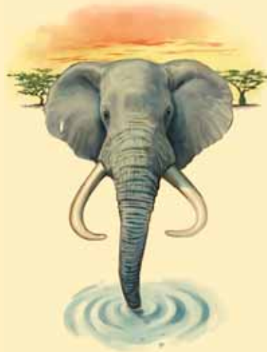
ZDROJ: Science, prosinec 2008