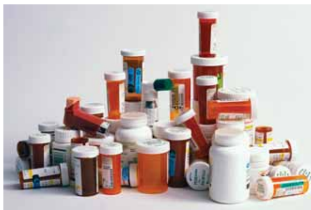
BEZPLATNÉ LÉKY: Státem uzákoněné programy pro darování nepoužitých léků se setkaly s omezeným úspěchem.

„Jen málo léků je dodáváno v balení po jednotkových dávkách,“ poznamenává Englebert, „a proto se jen velmi málo léků hodí pro darování.“ Navíc, nedostatek prostředků řadu programů ztěžuje. Bez databáze zúčastněných lékáren a jejich inventáře potřebují například příjemci obvolat každou registrovanou lékárnu a zeptat se, zda tam mají lék, který jim byl předepsán.