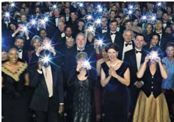
SVĚTLA, KAMERA... PROVÁZÁNÍ! Obrazy by teoreticky mohly být o poznání ostřejší, pokud se budou v blescích používat provázané fotony.

Jako možné vysvětlení navrhuje Lloyd, že i když může technicky provázání mezi dvěma fotony kompletně zaniknout, některé jeho