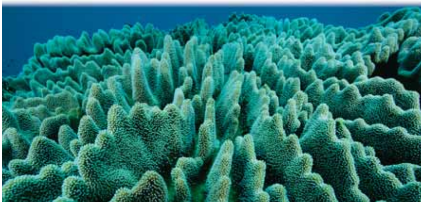
KORÁLY a další mořský život, bohatý na uhličitán vápenatý, při postupném okyselování oceánů mizí.

Wootton poznamenává, že změny, které jeho tým pozoroval, byly spojeny s rostoucí hladinou atmosférického \text{CO}_2 , ale ochotně uznává, že plyn spojený s globálním oteplováním nemůže být u tohoto nárůstu kyselosti hlavním viníkem. Místo toho by mohlo být pozorované okyselování výsledkem nedávného výstupu vody z hloubi oceánu, která je bohatá na uhlík, takže by se výsledky nevztahovaly na oceány jako celek. Přesto se zdá, že naměřené hodnoty kyselosti na pobřeží USA a Nizozemí stále rostou, říká Wootton, „a to se zdá konsistentní s naším modelem.“ Mořský život při své snaze vyrovnat se s novou skutečností podle všeho nemá času nazbyt.