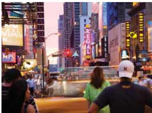
HLAVNÍ ULICE: Cestování po městě je pomalé a neefektivní, částečně proto, že řidiči sledují jen vlastní zájmy.

ve skutečnosti způsobí snížení celkové účinnosti sítě. Seoulský projekt tuto dynamiku obrací: uzavření dálnice – tedy snížení kapacity sítě – vylepší účinnost systému.